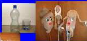
Из пластиковых бутылок и колготок, пакета для завтрака

Делаем куклу из носка, пакетика для завтрака